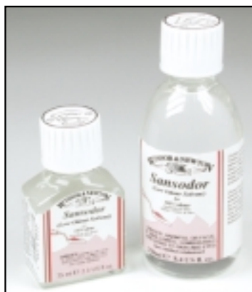
Sansodor es un disolvente de bajo contenido aromático ideal para los artistas que prefieren evitar la exposición a la trementina.

Los disolventes se reconocen por doquier como posibles peligros para la salud. Pero, bien empleados, no presentan peligros para la mayoría de los usuarios. Encontrará sugerencias para el uso debido de los disolventes en los consejos de higiene y seguridad en las páginas 20-25.