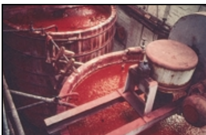
El cuarto del Rosa de Rubia en Wealdstone, Inglaterra.