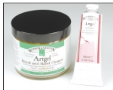
Artgel es un limpiador excelente para pinceles y manos.

Artgel es un agente limpiador que elimina rápida y eficazmente las pinturas al óleo y alquídicas de los pinceles y las manos con menos peligro que la trementina o el aguarrás. También devuelve a la piel su grasa natural además de preparar los pinceles.