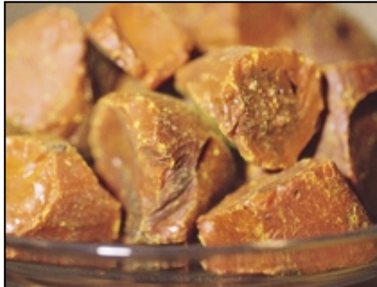
El Gutagamba auténtico proviene de una resina vegetal importada originalmente de Camboya a Europa en 1615.

Los amarillos más antiguos eran colores de tierras, muchos de los cuales se siguen usando. El Amarillo Indio es uno de los que tiene más historia (véase a continuación), en parte por su origen pero también por la auténtica maravilla de que a alguien se le ocurriera siquiera pensar en utilizar aquella materia prima.