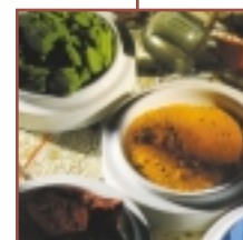
Winsor & Newton El especialista del color