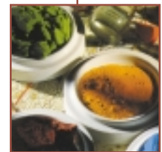
Winsor & Newton El especialista del color

El mejor espectro posible de cualquier gama es el que permite al artista mezclar el abanico más amplio posible de colores. Winsor & Newton selecciona pigmentos basados no sólo en las características individuales sino en aquellas que contribuyen a la mezcla en general y ofrecen oportunidades de expresión dentro de todo el espectro. Todas las gamas Winsor & Newton se pueden emplear para explorar todas las posibilidades de mezcla: de colores cálidos a fríos, de gama cromática alta a baja, pasando por todos los intermedios.