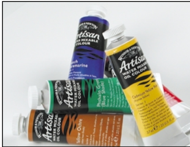
Los óleos miscibles en agua Artisan están formulados con aceite de linaza y de cártamo modificados para poder utilizar agua como disolvente. Artisan funciona y se seca igual que los óleos tradicionales sin el uso de trementina o aguarrás.

Además de sus excelentes cualidades de manejo y su calidad superior como colores para capas de pintura base y veladuras, está comprobado que los alquídicos de Winsor & Newton son extraordinariamente estables y duraderos.