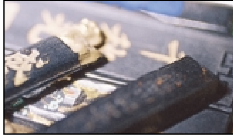
Las pastillas de tinta china se hacen tradicionalmente de carbón negro (o negro de humo) y aceites de pescado o animales.

Negro Azulado. En óleo es una mezcla de Negro Marfil y Ultramar.