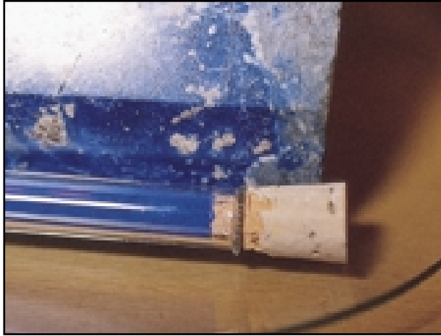
El lapislázuli es una piedra semipreciosa que se empleó como pigmento original para el azul ultramar. El Ultramar Artificial (Ultramar Francés) se lleva elaborando desde 1826, y su estructura química es idéntica a la de la piedra original.

Azul de Amberes. Una variedad más débil del primer pigmento orgánico sintetizado en laboratorio (aunque lo fuera accidentalmente), el Azul de Prusia.