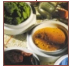
Winsor & Newton El especialista del color

Para determinar si un cuadro está listo para barnizar, aplique una pequeña cantidad de aguarrás (alcohol mineral) a un paño limpio. Con el mismo, frote con suavidad una esquina de la superficie del cuadro. Si no se