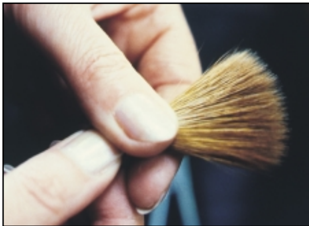
Unos pinceles finos pueden suponer una diferencia notable en el cuadro, ya que con ellos el pintor saca el máximo partido de las propiedades pictóricas del color.

Así como la calidad del color tendrá un profundo efecto en la calidad de su obra de arte acabada, del mismo modo los pinceles que elija supondrán una auténtica diferencia en su proceso de pintar. Los distintos pinceles ofrecen las virtudes concretas que mejor convienen a los distintos vehículos, mediums y aplicaciones. La elección del pincel contribuirá en gran medida a ayudar al artista a explorar con éxito una técnica concreta.