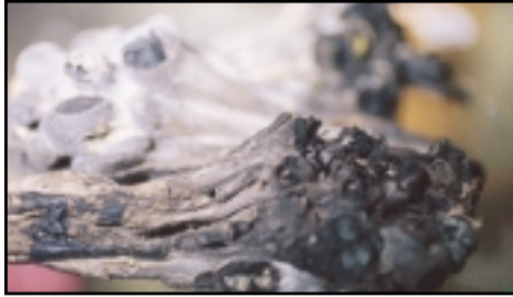
Bolsas de tinta de sepias, usadas históricamente en la producción del color Sepia. Hoy se elabora con una mezcla de Tierra de Sombra y negro.