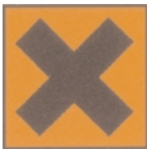
Símbolo de “Peligroso” en la UE

ejemplo, “Muy tóxico” y “Extremadamente inflamable”. La mayoría de los niveles de clasificación vienen acompañados de símbolos. Por ejemplo, una calavera para “Tóxico”. Además, estas clasificaciones pueden ir acompañadas por “frases de riesgo” y/o “frases de seguridad”. Todo material