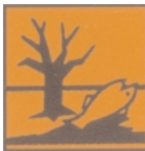
Símbolo de “Peligroso para el medio ambiente” en la UE

artístico que se encuentre en una de estas clasificaciones mencionadas deberá etiquetarse según corresponda. Las tres clasificaciones empleadas más comúnmente en los materiales artísticos son “Peligroso”, “Inflamable” y “Peligroso para el medio ambiente”. A continuación se muestran los símbolos para cada una de estas clasificaciones.