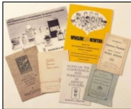
En 1892, Winsor & Newton fue el primer fabricante que publicó información técnica completa sobre pigmentos y colores.

Los pigmentos, además de tener propiedades ópticas singulares, poseen características físicas distintas. Unos tienen aristas y son irregulares; otros son lisos y redondos. Algunos absorben mucho óleo al molerlos, otros sólo una pequeña cantidad. En resumen, cada pigmento requiere procedimientos y detalles diferentes al ser molido.