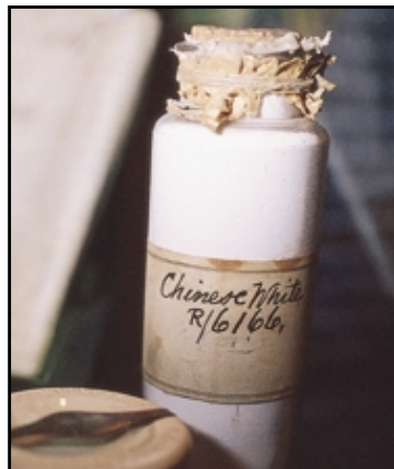
El Blanco de China, el imprimador blanco permanente semiopaco fue inventado por Winsor & Newton en 1834.

Los actuales blancos ofrecen una amplia serie de características en diversos grados de opacidad y son ideales para mezclar o cubrir, según la necesidad propia del artista.