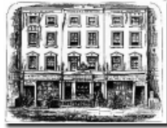
Winsor & Newton lanzó su aventura en 1832 en el número 38 de Rathbone Place.

Actualmente, Winsor & Newton tiene más experiencia en materiales artísticos que cualquier otro fabricante del mundo. Muchos de nuestros empleados son contratados tanto por su experiencia como artistas como por sus conocimientos técnicos. Esa modesta sociedad creada hace casi dos siglos acabó convirtiéndose en la firma de materiales artísticos de más renombre en el mundo.