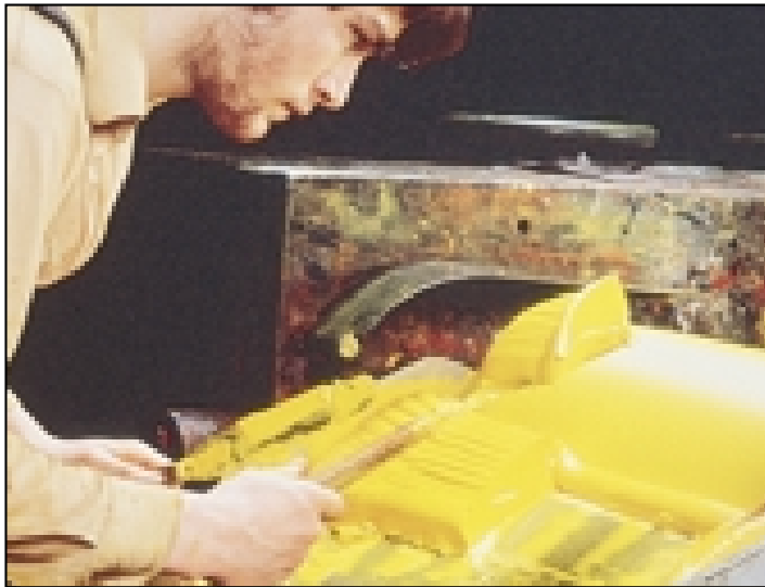
La molienda o trituración del color es un proceso exigente, que precisa la selección atenta y equilibrada de cada ingrediente para asegurar las mejores características de trabajo.