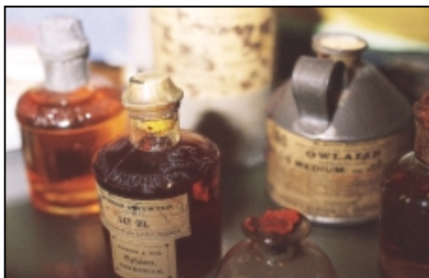
Los vehículos de pintura y los óleos de calidad superior se mantendrán estables en el tubo durante décadas y permanecerán en la superficie por muchas generaciones. En la imagen se muestra una selección de vehículos y óleos que datan de la década de 1880 y que están expuestos en el museo Winsor & Newton de Wealdstone, Inglaterra.