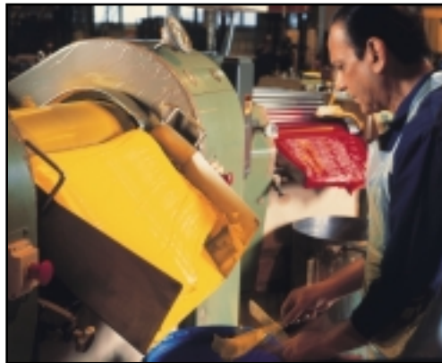
Los óleos Artists están formulados y mezclados siguiendo las especificaciones más exactas, lo que permite a los artistas sacar el máximo provecho de las características únicas de cada pigmento. Los óleos Winton ofrecen características de trabajo óptimas a un precio económico.