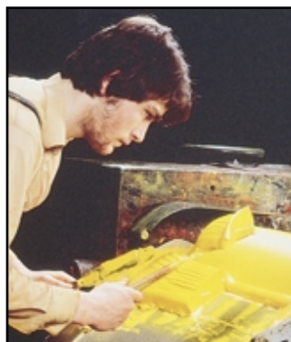
Molienda de óleos en un molino de tripe rodillo en la fábrica de Winsor & Newton.

conocimientos técnicos necesarios para formular todos y cada uno de los colores exactamente de la manera que mejor sirve a los artistas. Existen ciertas cualidades como la luminosidad del color o la facilidad y consistencia de la aplicación cuyo papel es esencial para el éxito de un artista. Sabemos, tras dos siglos de experiencia, que nuestros productos proporcionan exactamente eso.