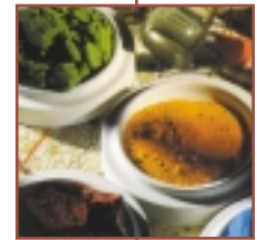
Winsor & Newton El especialista del color

Debido a la naturaleza más espesa de la pintura y a la aspereza del lienzo, los pinceles de cerdas naturales son ideales para óleos. La calidad óptima de las cerdas posee una flexibilidad uniforme y tiene tendencia a "hendirse", o dividirse en la punta. Estas puntas hendidas son deseables, pues permiten arrastrar la pintura por la superficie con mayor consistencia y control. Los mejores pinceles de cerda han sido fabricados de manera que se aprovecha el ligero rizo natural de las cerdas, montadas de forma que se curven hacia dentro y se entrecrucen de manera natural. El entrecruzamiento de las cerdas es lo