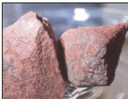
El cinabrio es el principal mineral del mercurio, y la forma mineral natural del Bermellón.

Hasta la introducción del Rojo de Cadmio a principios del siglo XX, el rojo más vivo y dinámico era el bermellón. Producido en un principio como pigmento pulverizado del cinabrio, el color es una forma de sulfuro de mercurio (HgS). El cinabrio fue utilizado por griegos y romanos y transformado en una forma más pura de bermellón, sobre todo por los chinos. El rico matiz resultante tan increíblemente limpio no fue igualado por ningún otro pigmento. Debido a los peligros tóxicos del proceso de elaboración, el bermellón ya no existe. Por suerte, para cuando el color dejó de producirse, habían aparecido los cadmios para sustituirlo.