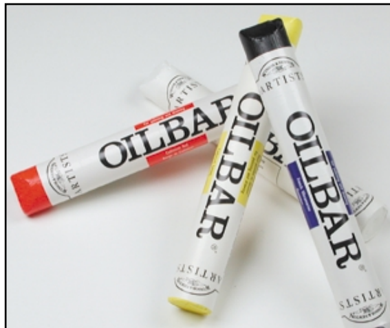
Artists Oilbar es un óleo combinado con ceras selectas que da lugar a una barrita de color adecuada para aplicaciones directas y dinámicas.

El óleo miscible en agua de la mejor calidad crea la emulsión inmediatamente después de añadirsele agua. Esta emulsión autogenerada, usada en la fórmula de Artisan, ofrece el tipo de consistencia y la facilidad de manipulación más tradicionales. La única modificación química del aceite de linaza es para permitir la mezcla con agua en vez de con disolventes. Esto no compromete para nada las características de manipulación ya que éstas son exactamente iguales a la de los óleos tradicionales.