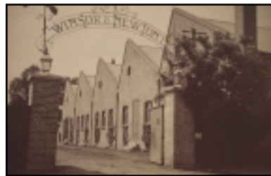
La fábrica Winsor & Newton en 1909