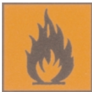
Símbolo de “Muy inflamable” en la UE