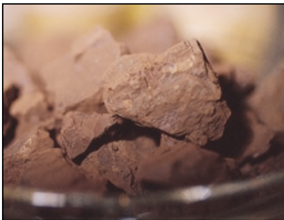
El Tierra de Colonia o Pardo Van Dyke se fabrica a partir de sustancias orgánicas parecidas al lignito o al pardo de carbón.

Junto con los negros de carbón y blancos prehistóricos, los colores de tierra formaban la mayor parte de la paleta de un artista hasta la Edad Media. La transparencia de piedra preciosa (debida a la presencia de silicato alumínico en el pigmento) y la rica tonalidad de las tierras de Siena de la mejor calidad fueron los colores decisivos desde Rembrandt a Wyeth. Lamentablemente, a principios del siglo XXI, cada vez va siendo más difícil obtener las mejores tierras de Siena, lo que obliga a los fabricantes que insisten en usar pigmentos naturales a producir un color de menor calidad. Winsor & Newton prefiere, en muchos casos, hacer uso de pigmentos de tierras sintéticos recién desarrollados en vez de las restantes tierras naturales. Aunque son productos de laboratorio, los nuevos óxidos de hierro sintéticos poseen una estructura física que ofrece muchas de las cualidades que hacían tan extraordinarios los primeros colores de tierras.