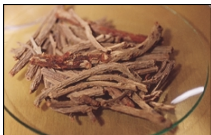
La raíz de granza se transforma en pigmento para el color Rosa de Rubia Auténtico, mediante un proceso exclusivo desarrollado por el colorista George Field en 1806. Winsor & Newton es el único fabricante del mundo de este histórico color.