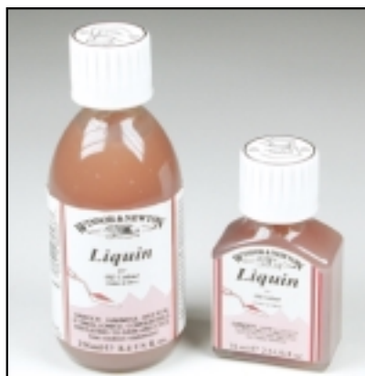
Sansodor es un disolvente muy poco aromático, adecuado para pintores que prefieren evitar verse expuestos a la trementina.