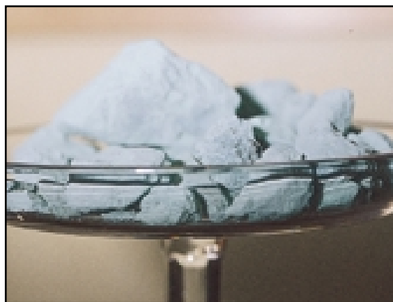
Terre Verte (tierra verde) es un pigmento de tierra usado en los murales romanos de Pompeya. Sigue empleándose hoy.