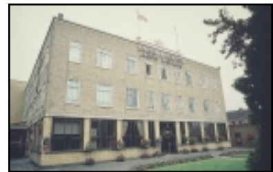
Entrada principal de la fábrica Winsor & Newton en Wealdstone, Inglaterra, en la actualidad.

La creación de cualquier color para artistas requiere una técnica asombrosa. No consiste simplemente en añadir pigmentos a aceite de linaza y mezclar una cantidad. La fabricación de colores verdaderamente exquisitos requiere un extenso conocimiento de los diferentes pigmentos, los aceites de secado y la manera como el casi infinito número de variables afecta al producto final. Cada pigmento absorbe el aceite de manera distinta, lo cual requiere cuidadosos e individuales procesos de molido para proporcionar al artista un color que ofrece una concentración de color óptima, que permanece en suspensión estable en el tubo y que forma la capa de pintura más permanente posible.