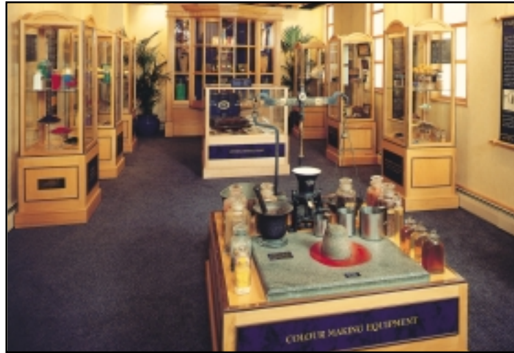
El museo del color de Winsor & Newton en Wealdstone, Inglaterra, incluye pigmentos y materiales empleados en la fabricación de colores exquisitos. Algunos de estos materiales son únicos y se remontan a miles de años.

Al principio, eran los aprendices del maestro pintor los que preparaban los óleos en el estudio. A finales del siglo XVIII, surgieron en Europa las tiendas de coloristas, ofreciendo colores previamente molidos. En el año 1832, se funda en Londres Winsor & Newton.